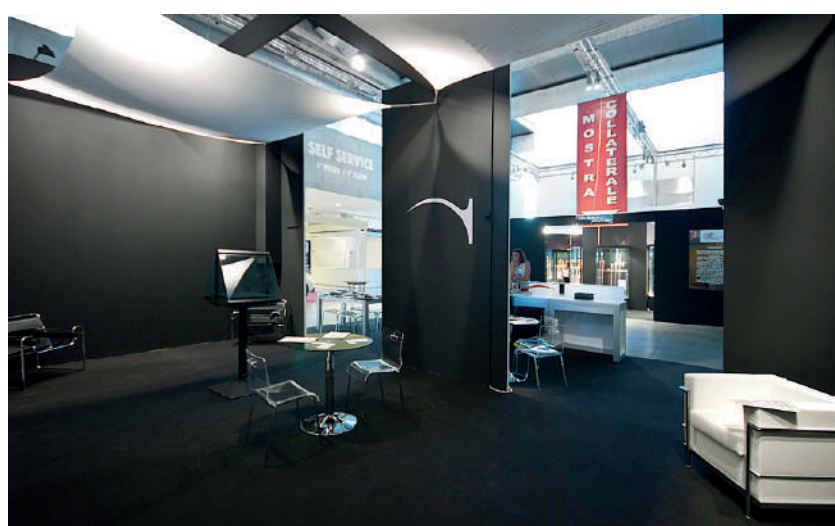
Un esempio degli stand dell'edizione 2012 di Gotha

Tra le opere in mostra, una tavola seicentesca raffigurante una natura morta assegnata al fiammingo Jan Vonck e un