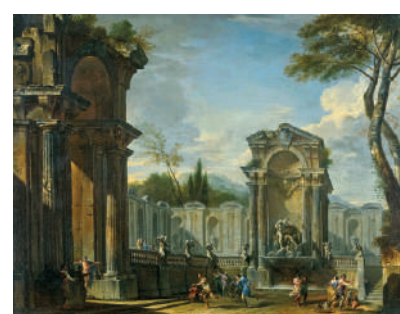
«Capriccio architettonico con una fontana romana», opera di Giovanni Paolo Pannini presentata a Paris Tableau da Cesare Lampronti

In collaborazione con l'associazione «Ciné d'hier», in due giorni (il 9 e il 10 novembre) sono programmati nell'auditorium della sede parigina, a ingresso libero, quattro film strettamente connessi